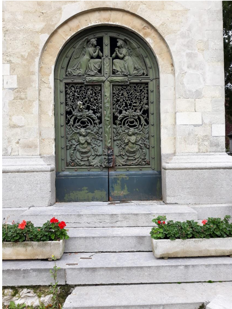
Graf van La Malibran

De gestorven leden van de koninklijke Belgische familie liggen begraven in de Koninklijke Crypte, onder de Onze-Lieve-Vrouwekerk, de monumentale neogotische kerk die het orgelpunt is van een site waarvan de grandeur in steen is gehouwen.